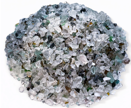
Recycling von Altglas